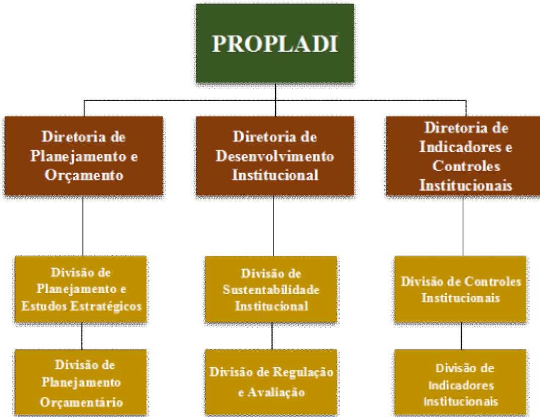
Figura 1. Organograma da PROPLADI

Cumprido ressaltar que as Diretorias ainda não são unidades administrativas da PROPLADI pois não possuem Cargo de Direção disponível para sua implementação. Da mesma forma, a Divisão de Indicadores Institucionais também não foi efetivamente implementada no organograma institucional que é representado no Sistema Organizacional do Governo Federal (SIORG), pela ausência de função gratificada para a sua implementação. Conforme o Regimento Interno da PROPLADI, as atividades executadas nessas unidades são realizadas pelos servidores, sendo que, na ausência das funções, a autoridade é exercida pelos pró-reitores responsáveis.