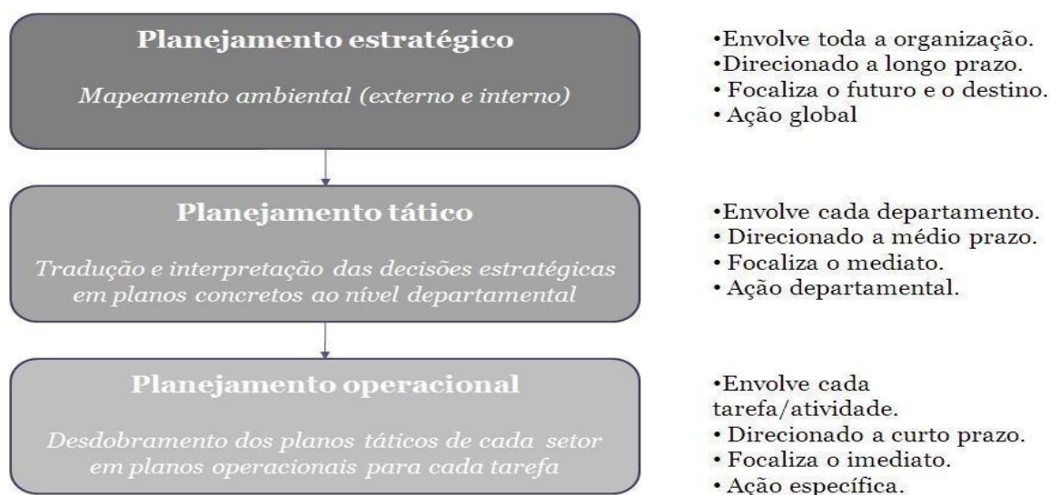
Figura 1: Níveis de Planejamento

O planejamento da Universidade Federal Rural da Amazônia está dividido nos níveis estratégico, tático e operacional. O planejamento estratégico tem-se uma visão de longo prazo, representado pelo Planejamento Estratégico Institucional (PLAIN). No Plano tático tem-se uma visão de médio prazo, representado pelo Plano de Desenvolvimento da Unidade (PDU). E por fim tem-se o planejamento operacional com uma visão de curto prazo.