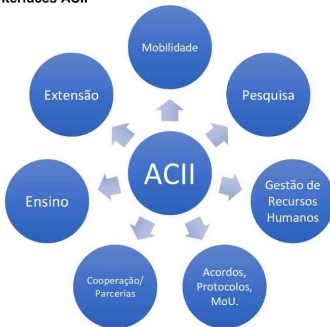
Figura 02 - Interfaces ACII

Deste modo, a ACII está envolvida na mobilidade de discentes e servidores de todos os setores da universidade; na pesquisa, mediante a concretização de parcerias para a produção conjunta de pesquisadores de instituições diferentes; na gestão de recursos humanos, gerenciando a colocação de servidores em outras instituições para qualificação e capacitação; no âmbito legal, mediante a confecção de acordos, protocolos e afins; para o estreitamento de parcerias, elaboração de projetos conjuntos, ensino e extensão. Em suma, a ACII exerce uma função transversal e agregadora de extrema importância na UFRA, que busca construir pontes e ampliar a visibilidade tanto nacional quanto internacional.