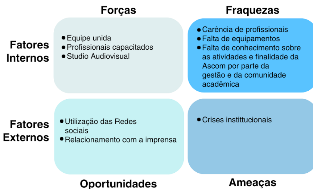
Figura 3 – Análise SWOT