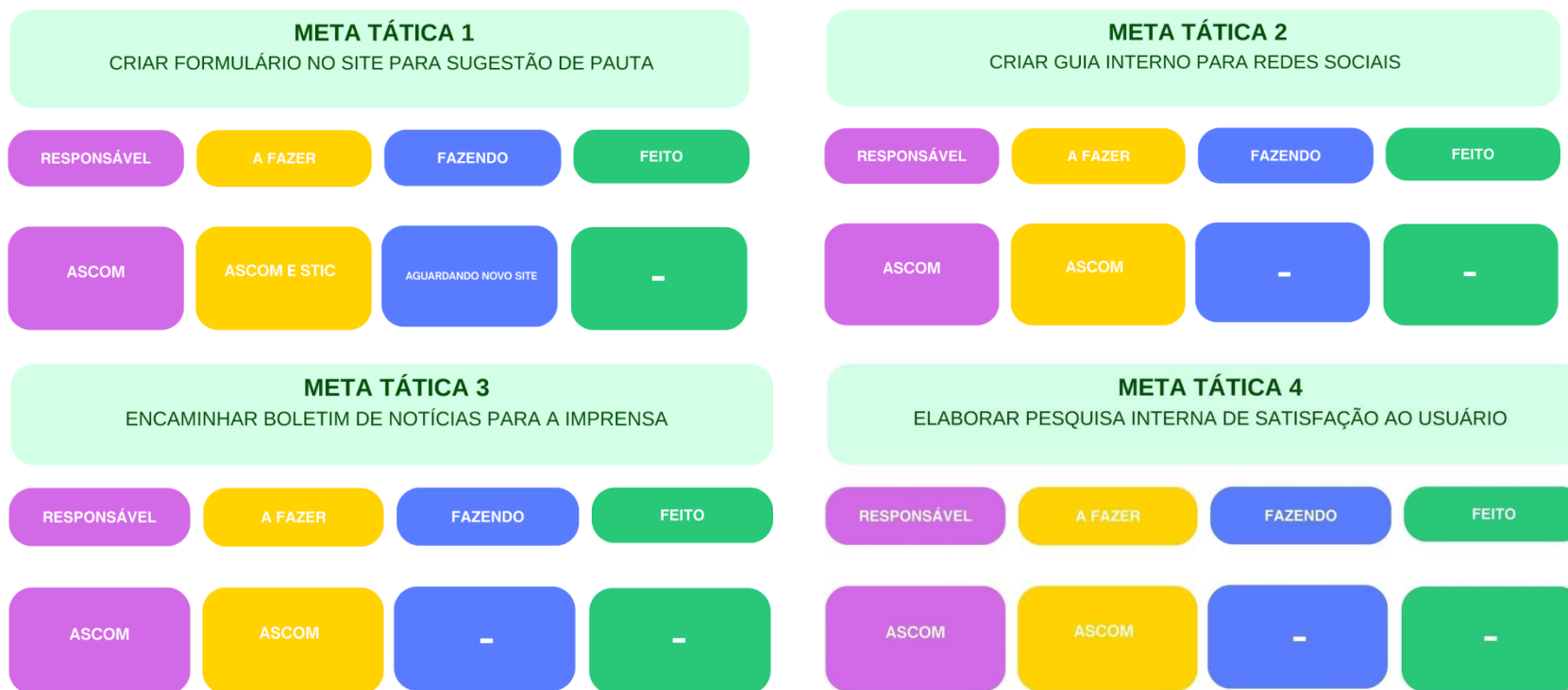
Figura 4 – Método Kaban

Para o monitoramento das ações, será adotado o método Kaban, conforme figura abaixo: